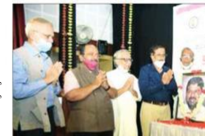
ಆಗಲಿರುವ ಚೇತನಗಳ ಭಾವಚಿತ್ರಗಳಿಗೆ ಪುಷ್ಪನಮನ ಸಲ್ಲಿಸಲಾಯಿತು.