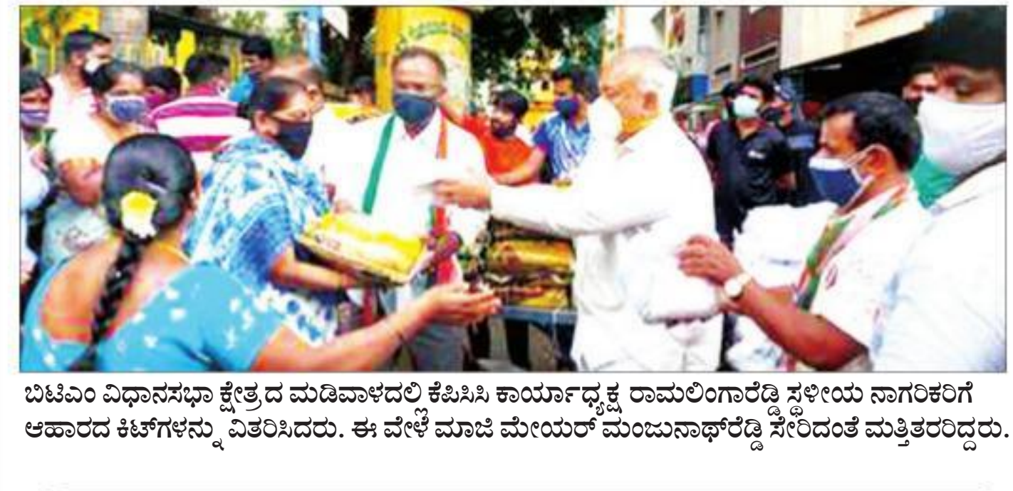
ಬಿಬಿಎಂ ವಿಧಾನಸಭಾ ಕ್ಷೇತ್ರದ ಮಡಿವಾಳದಲ್ಲಿ ಕೆಪಿಸಿಸಿ ಕಾರ್ಯಾಧ್ಯಕ್ಷ ರಾಮಲಿಂಗಾರದ್ಡಿ ಸ್ಥಳೀಯ ನಾಗರಿಕರಿಗೆ ಆಹಾರದ ಕಿಟಕಿಗಳನ್ನು ವಿತರಿಸಿದರು.